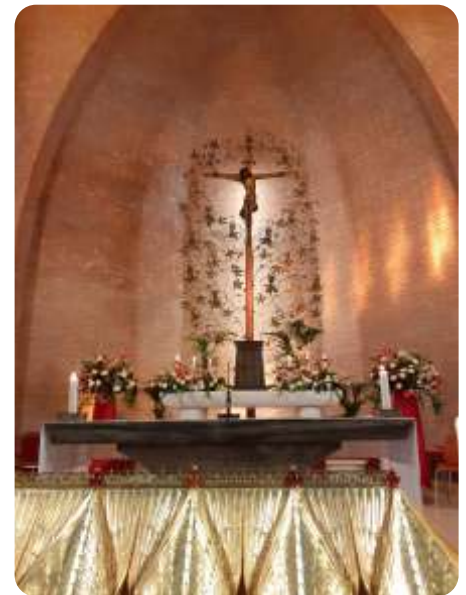
Martelaren van Gorcum, Brielle

Deze bijeenkomst zal plaatsvinden op zaterdag 15 november, van 10.00-12.00 uur in het Paus Franciscushuis in Lisse. U bent van harte welkom.