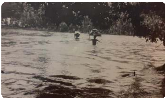
"M'n dragers dragen m'n bagage door het water. 25 April '33"