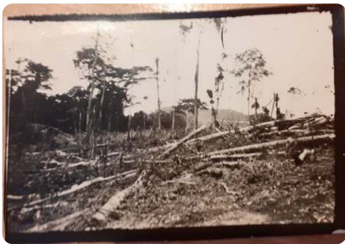
"Okoyong, Mamfe. De nieuwe Missie. Het omhakken en opruimen. June '34" Er wordt oerwoud gekapt voor de bouw van de eerste parochiekerk in Mamfe.