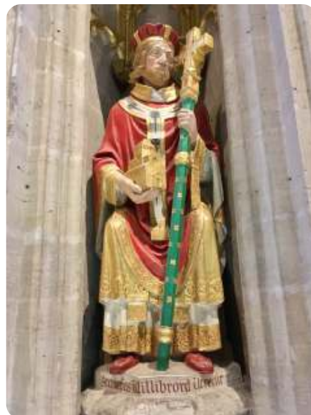
Beeld van H. Willibrordus, Ripon