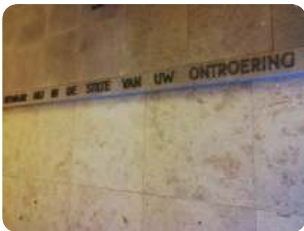
Graven Heilig Land