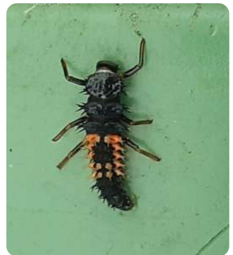
Niet alleen volwassen lieveheersbeestjes eten bladluizen, hun larven doen dat ook.

Misschien een idee, als dat mogelijk is, een regenton aan te sluiten. Die zijn tegenwoordig in alle soorten en maten beschikbaar.