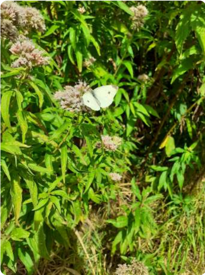
Vlinders zijn 'geveugelde rupsen', dus als u wilt genieten van kleurrijk gefladder, zult u de rupsenvraat moeten gedogen...

Is ons huis wel echt van ons? We zeggen vaak dat spullen van ons zijn, dat een huis van ons is en dan maken we er wel ook echt ons eigen plekje van. Maar als je even uitzoomt en het bekijkt over de loop der jaren, dan snappen we allemaal dat het maar tijdelijk is. In het beeld van de eeuwigheid leven we slechts een aantal prachtige jaren. We verzorgen alles wat ons lief is en hebben daar veel voor over. Een gedachte die ook terugkomt in de christelijke roots van onze samenleving.